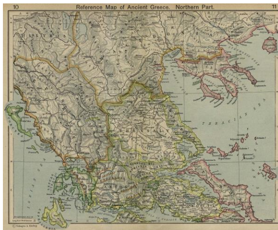
22.1 Χάρτης της Θεσσαλίας (κέντρο)